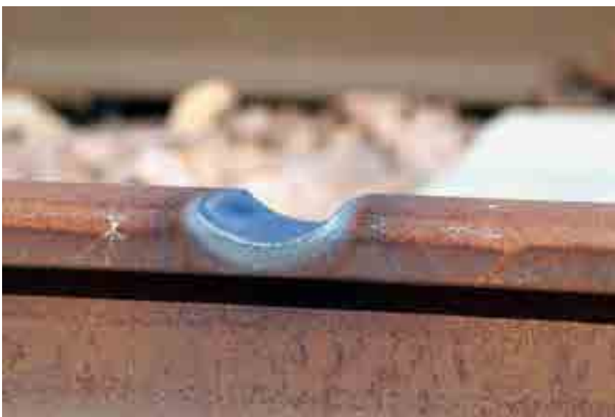
! Bild 5: Fuge im Schienenkopf zur Herstellung einer Thermit®-Head Repair-Schweißung

Somit ist neben den technischen und qualitativen Anforderungen – die Gewährleistung der Sicherheit – ein weiteres wichtiges Kriterium für den Einsatz von Thermit® für die Eisenbahn-Infrastrukturbetreiber erfüllt: die Wirtschaftlichkeit. Die